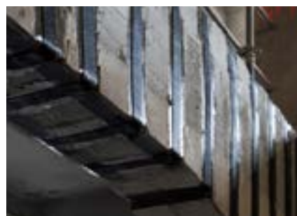
S&P C-Sheet (Poutre renforcée à l'effort tranchant)

En France, le système «FRP S&P» est sous Avis Technique CSTB (S&P C-Laminate collée ou engravée, S&P C-Sheet et les colles associées).