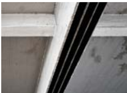
S&P C-Laminate collées en sous face (flexion en travée)