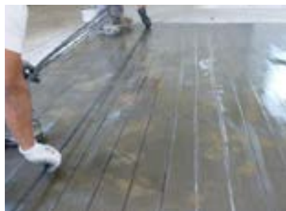
S&P C-Laminate engravées (flexion sur appui)