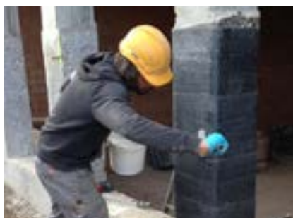
S&P C-Sheet (Pilier renforcé par confinement)