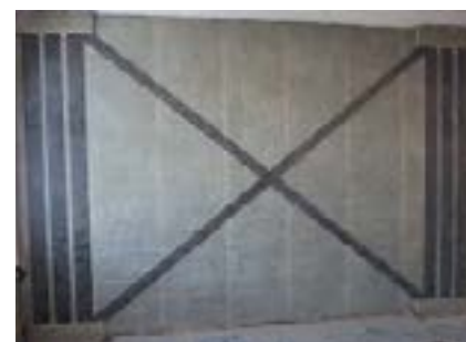
Renforcement de maçonnerie (parasismique)