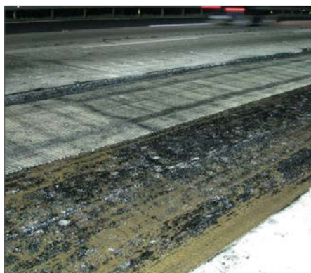
▲ S&P asphalt reinforcement grid laid onto bitumen tack coat